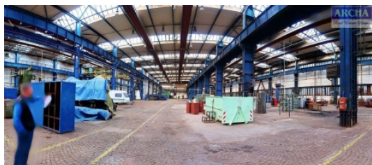
2.900 m 2 , nájem 60,-Kč/m 2 /měsíc Praha 4