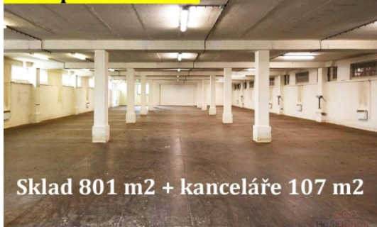
Sklad 801 m2 + kanceláře 107 m2