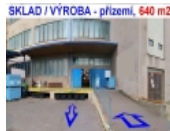
SKLAD / VÝROBA - přízemí, 640 m 2

ARCHA - průmyslová kancelář ( Praha, Beroun ) Mob: 608 827 778, E-mail: archa.sklady@seznam.cz, www.archacs.cz