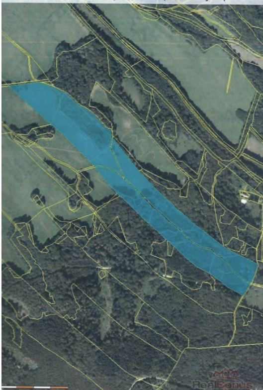
Ortofotomapa ložiska s vyznačením předmětných pozemků

Prodej pozemku 80 000 m2, určený pro komerční výstavbu, Vápenná (okres Jeseník)