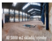
Až 5000 m 2 skladů / výroby