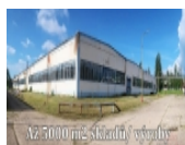
Až 5000 m 2 skladů / výroby