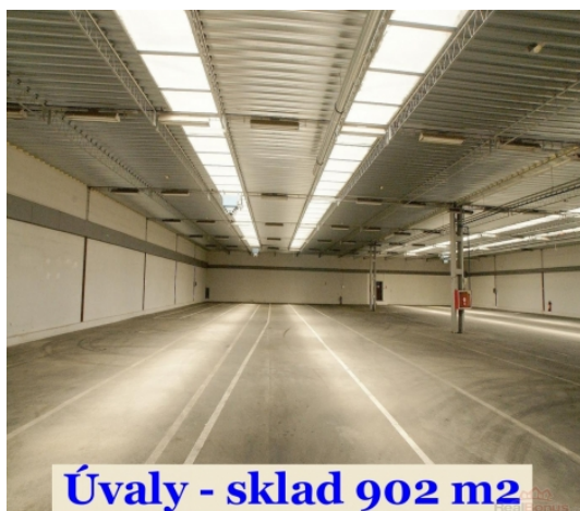
Úvaly - sklad 902 m2