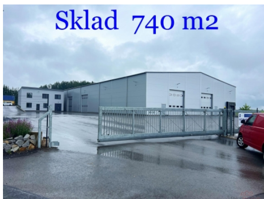
Sklad 740 m2