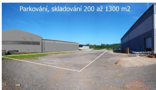
Parkování, skladování 200 až 1300 m 2

Pronájem pozemku 1 000 m 2 , určený pro komerční výstavbu, Králův Dvůr, Popovice (okres Beroun)