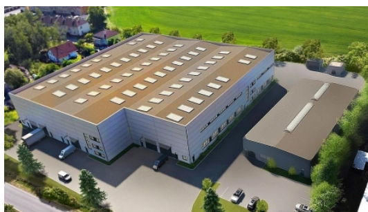
Novostavba 5.900 m2, Hořovice